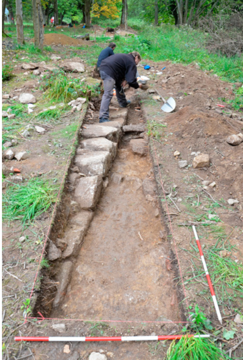
▲ Objekt č. 18, pravděpodobně součást kanalizace či vodovodu města.